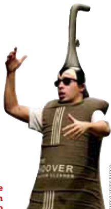
Terry Jones acha que os aspiradores têm algo de malvado

O Público Vídeos disponibiliza imagens de excertos desta entrevista a partir de hoje em www.publico.pt e a entrevista integral está disponível em podcast.