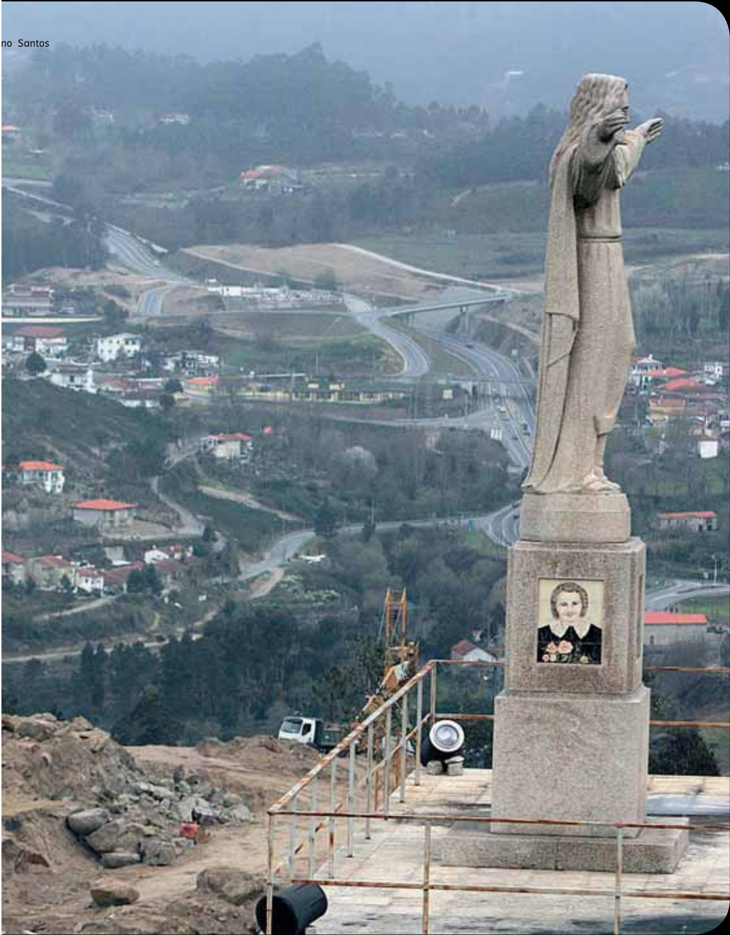
O MARCO VISTO A PARTIR DA MANSÃO EM CONSTRUÇÃO DO AUTARCA