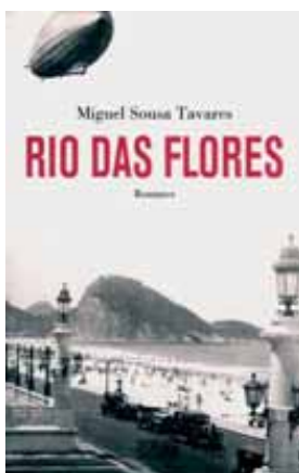
Rio das Flores Miguel Sousa Tavares Oficina do Livro, 628 págs, €29